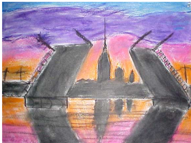
рис. Соловьева Ж., 5 кл.