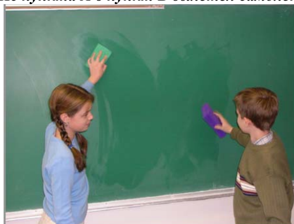
Дежурство в классе