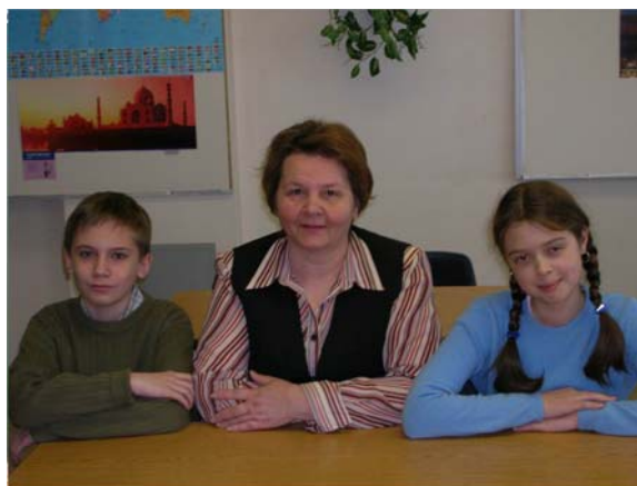
Нас в классе только двое