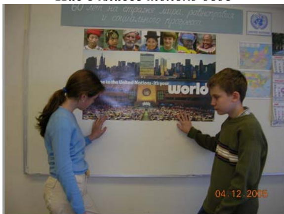
Ответ на уроке