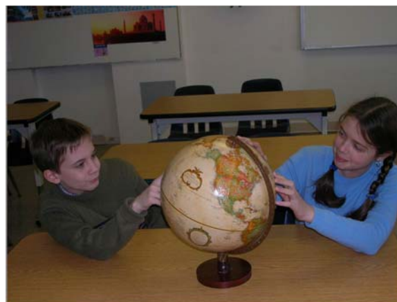
Из пункта А в пункт Б вылетел самолет