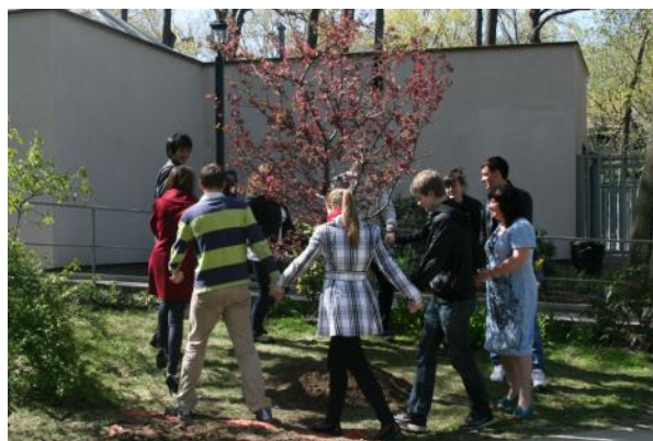
Хоровод как вокруг елочки