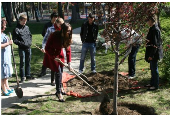
Дружно взялись за лопаты