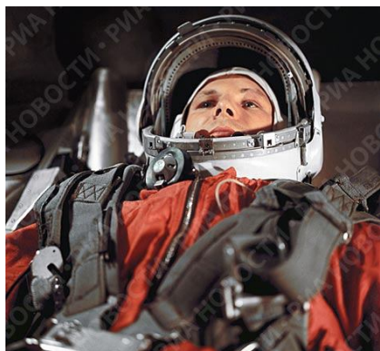
жданин Советского Союза Юрий Гагарин.