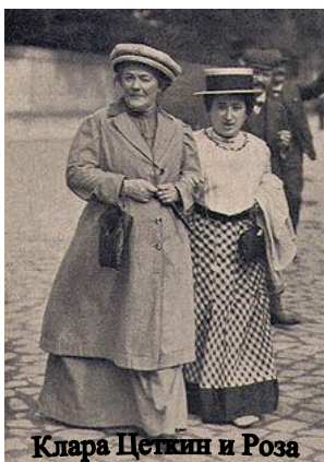
Клара Цеткин и Роза Люксембург, 1910 год

8 марта 1908 года по призыву Нью-Йоркской социал-демократической женской организации состоялся митинг с лозунгами о равноправии женщин. В этот день более 15000 женщин прошли маршем через весь город, требуя сокращения рабочего дня и равных условий оплаты с мужчинами. Кроме того, выдвигалось требование предоставления женщинам избирательного права. В 1909 году Социалистическая партия Америки объявила национальный женский день, который отмечался вплоть до 1913 года в последнее воскресенье февраля. Клара Цеткин в 1910 году, на Второй Международной социалистической женской конференции, проходившей в Копенгагене 27 августа в рамках Восьмого конгресса Второго Интернационала, предложила учредить международный женский день.