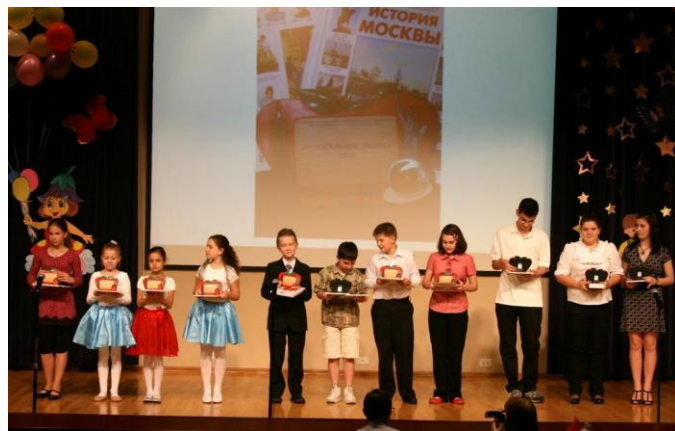
Победители в номинации «За усердие в учёбе»

Ребята получили подарки, но самое главное – общественное признание.