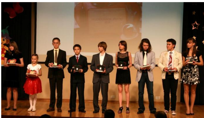
Победители в творческой номинации