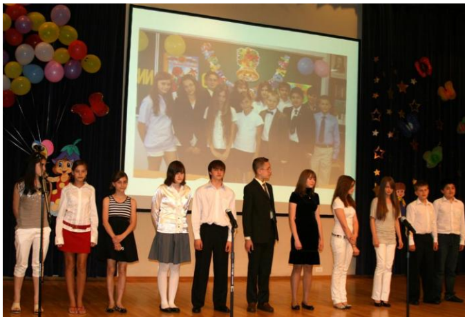
Победители в номинации «Достижения в спорте»