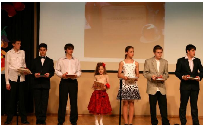
Победители в двух номинациях

классика: собрание сочинений А.П.Чехова в 6-ти томах, четырехтомник В.Набокова, а также «Архипелаг Гулаг» А.Солженицына, пользующийся у наших одиннадцатиклассников большой популярностью.