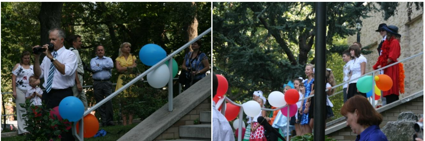
Все готовы к началу линейки: и оператор, и родители, и артисты... Ждем сигнала...

Какая замечательная вещь – постоянство! Как приятно осознавать, что несмотря ни на что 1 сентября начнется новый учебный год, что обязательно в этот день во все российские школы, где бы они ни находились, придут дети, что первоклассников все будут поздравлять со вступлением в школьную жизнь, что прозвонит первый звонок.