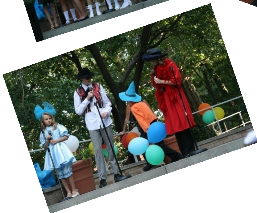
А потом на сцене, благодаря стараниям Иванова В.А. и Касьяновой Н.А. начинается настоящий карнавал сказочных героев: Мальвина, Незнайка, Буратино, кот Базилио, лиса Алиса...