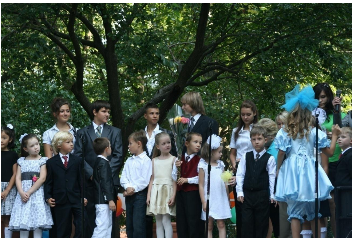
А вот и главные герои праздника! Школа приветствует первоклассников и выпускников!