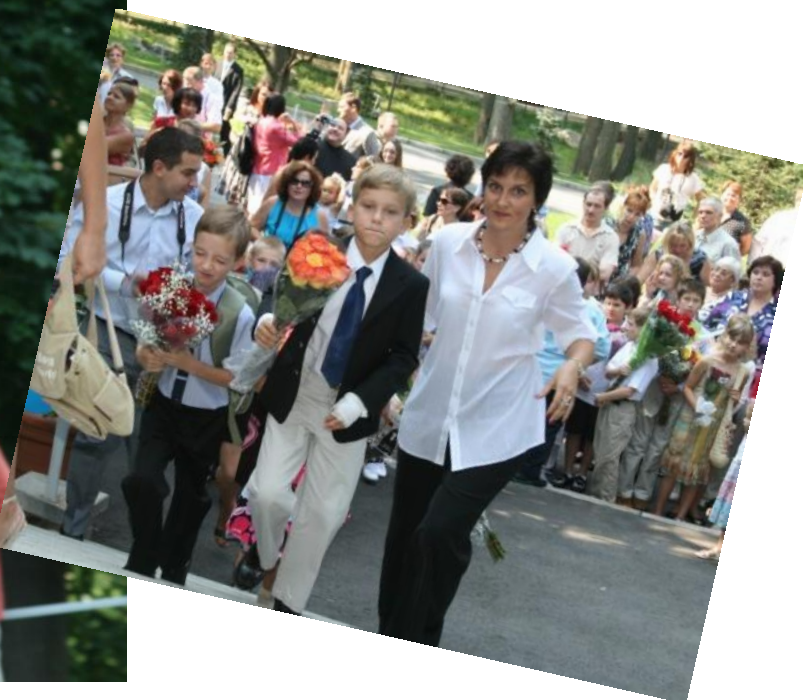
Вперёд, на штурм знаний!