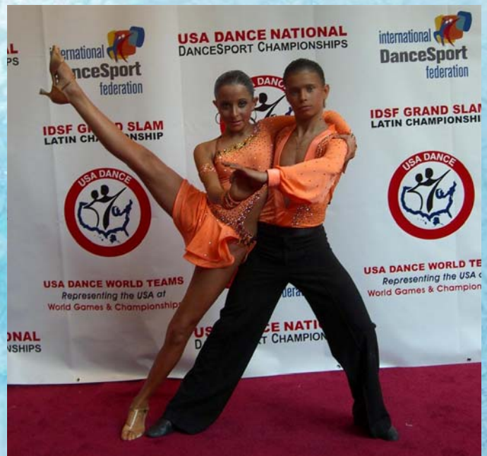
14 ноября 2009 года в Gar Field, штат New Jersey проходил один из популярнейших конкурсов балльных танцев Восточного побережья США «Nyemchek s Junior All-Star».

В зависимости от уровня подготовки участники распределялись по номинациям и возрастным категориям.